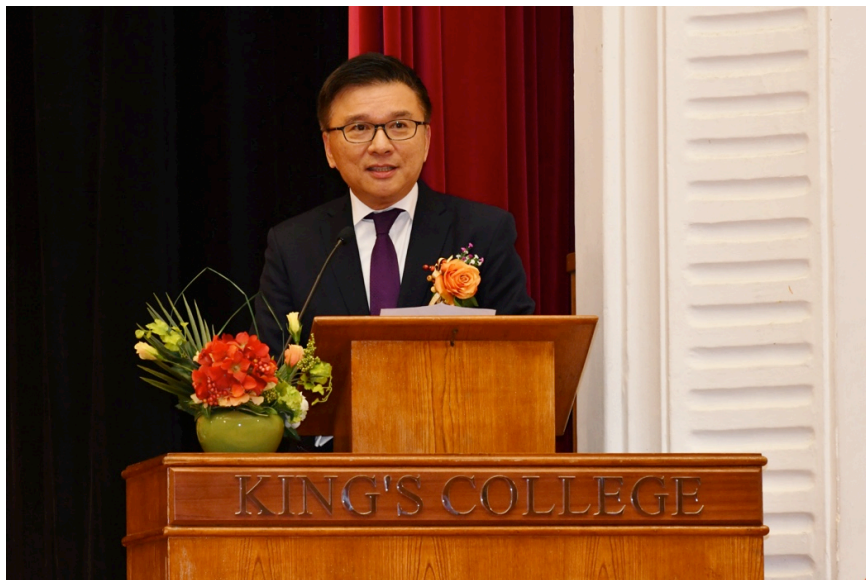
英皇書院周年頒獎典禮主禮嘉賓陳家強先生