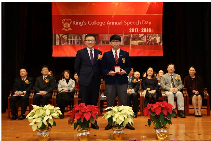
陳教授頒發獎座予表現優異的同學