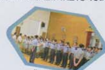
制服團隊迎新活動日