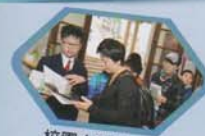
校園大使向參觀人士介紹本校歷史