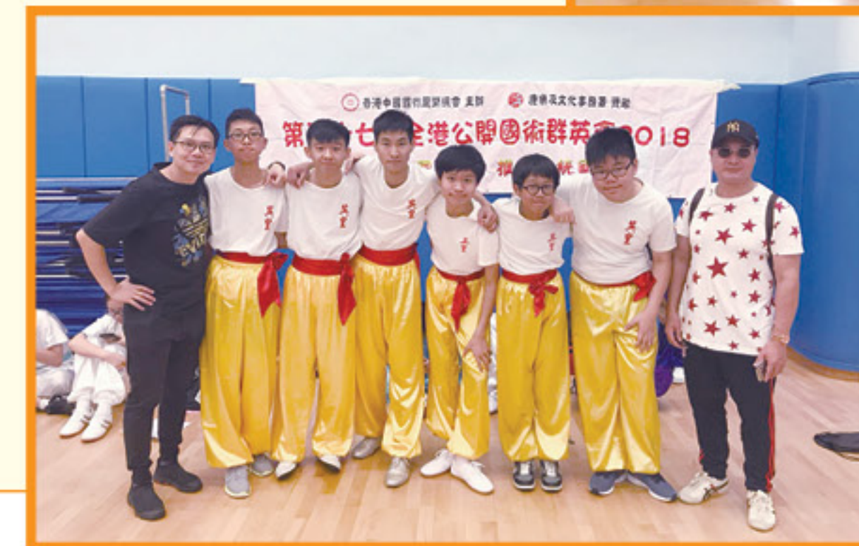
香港學界體育聯會 港島及九龍地域中學分會